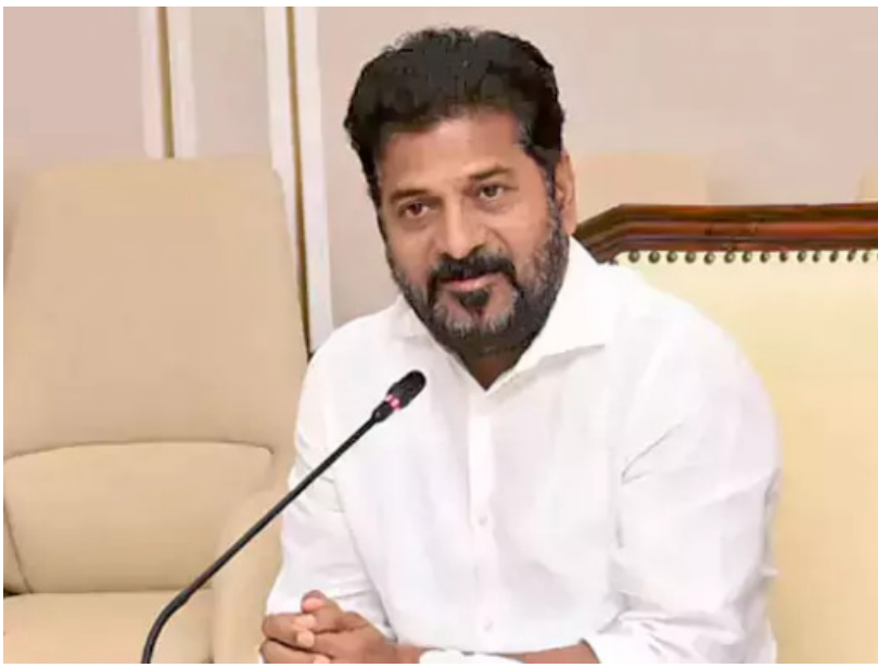
ఈ సమావేశంలో పలువురు మంత్రులు, పాల్గొన్నారు. సీఎన్, ఉన్నతాధికారులు, కలెక్టర్లు

హైదరాబాద్: అర్బులందరికీ సంక్షేమ పథకాలు అందేలా చర్యలు చేపట్టాలని సీఎం రేవంత్ రెడ్డి కలెక్టర్లను ఆదేశించారు. రేషన్ కార్డులు, సన్నబియ్యం, ఇందిరమ్మ ఇళ్లు, 200 యూనిట్ల ఉచిత విద్యుత్ పై లబ్ధిదారుల అభిప్రాయాలను ప్రజల్లోకి తీసుకెళ్లాల్సి అని సీఎం రేవంత్ అన్నారు. ప్రజా పాలన- ప్రగతి ప్రణాళికపై కలెక్టర్లకు దిశా నిర్దేశం చేశారు. 99 రోజుల కార్యచరణలో అందరి భాగస్వామ్యం ఉండాలని సీఎం పిలుపునిచ్చారు. "గ్రామం నుంచి జిల్లా స్థాయి వరకు ప్రజాప్రతినిధుల భాగస్వామ్యం ఉండాలి. విద్యావ్యవస్థలో తీసుకువస్తున్న మార్పులపై ప్రజలకు అవగాహన కల్పించాలి. ప్రభుత్వ ఆస్పత్రులను మెడికల్ కాలేజీలతో అనుసంధానం చేయాలి. మధ్యాహ్న భోజనం ఏజెన్సీలకు ప్రతినెలా బిల్లులు చెల్లించాలి" అని సీఎం అన్నారు.